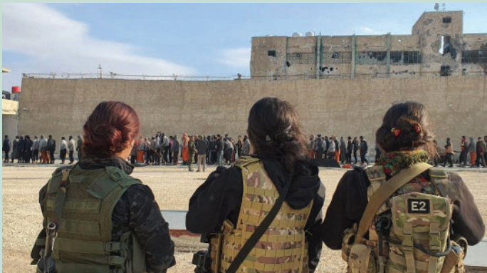
Sopra: le combattenti delle YPJ monitorano la situazione nella prigione di Al-Sinaa ad Hasakah.

L'attuale presenza dell'ISIS non si focalizza tanto nell'amministrazione delle città quanto in una "strategia dei piccoli passi." Attraverso tattiche di piccoli gruppi, un complesso finanziamento del terrorismo tramite hub regionali e una propaganda online estremamente efficiente, il gruppo cerca di mantenere viva la propria ideologia in tutto il mondo e di mobilitare attori solitari.