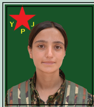
la martire Newroz Rodî