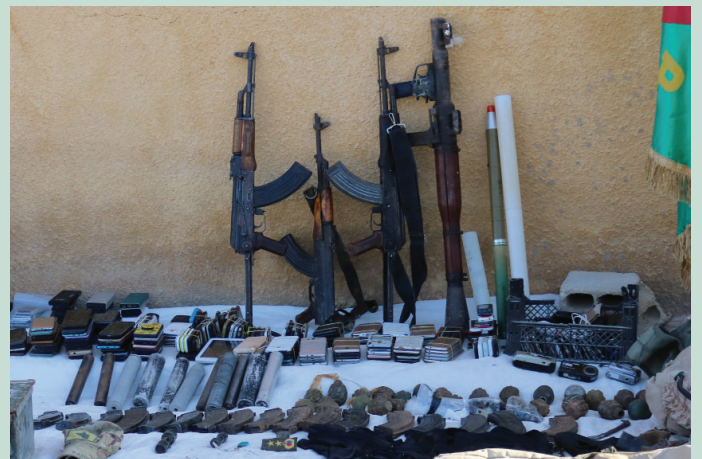
Lesito di un'operazione di sicurezza nel 2022 nel campo di Al-Hol.

serbatoio umano e ideologico per un'organizzazione che, pur non controllando più alcun territorio, non ha perso la sua influenza. Per anni, l'Amministrazione Autonoma (DAANES) ha avvertito che questi campi potevano diventare luoghi in cui le ideologie estremiste continuano a mettere radici e ad essere trasmesse alle generazioni successive, poiché i bambini crescono in questo ambiente, imbevuto di credenze islamiche jihadiste.