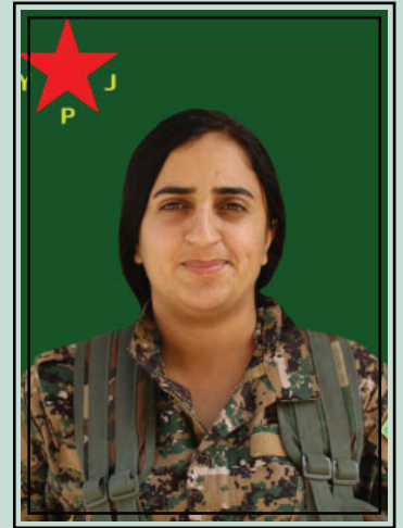
la martire Sozdar Bawer