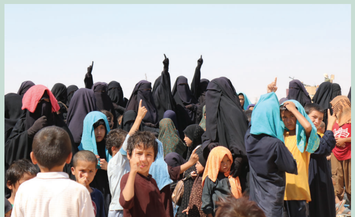
Donne e bambini mostrano il cartello dell'ISIS all'interno del campo di Al-Hol.