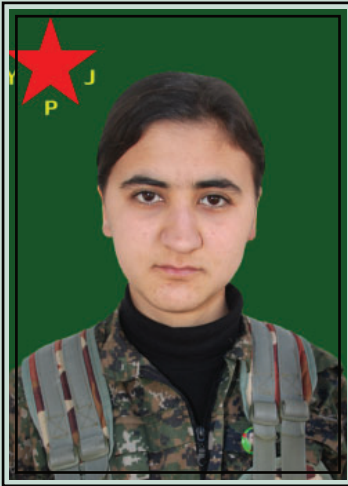
la martire Mijdar Gabar