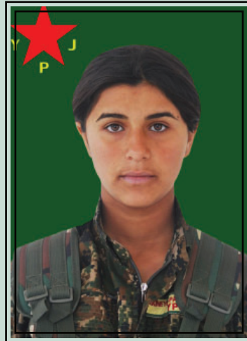
la martire Amara Cerablus