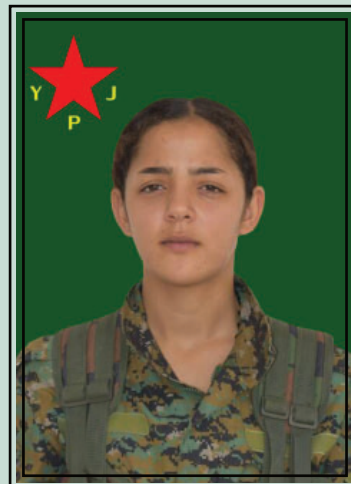
la martire Amargî Tolhîldan