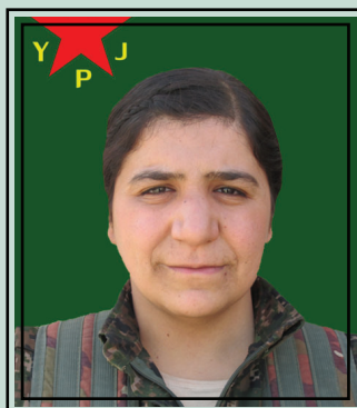
la martire Rojbîn Cûdî