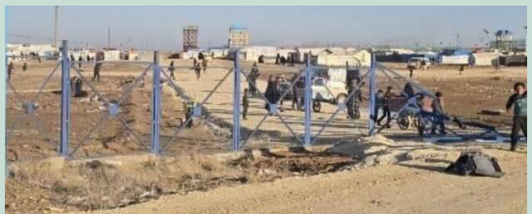
A destra: gennaio 2026, i detenuti del campo di Al-Hol fuggono attraverso un varco nella recinzione.