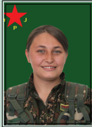
la martire Özgür Amed