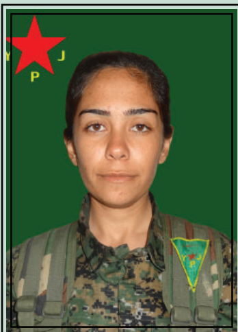
la martire Arîn Qamişlo