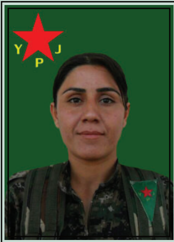
la martire Seal Cudî