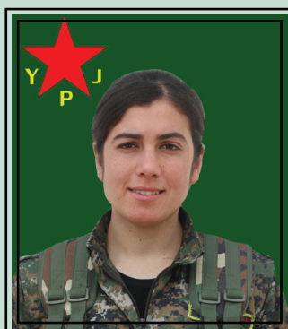
la martire Evrîm Çiya