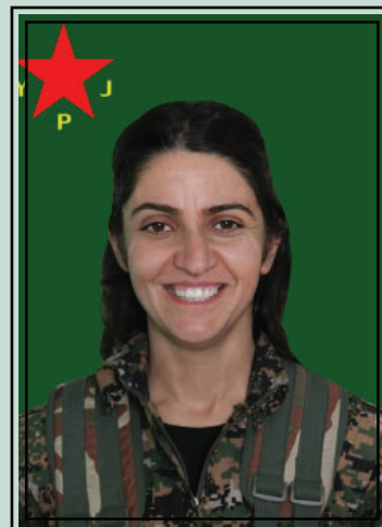
la martire Deniz Medya