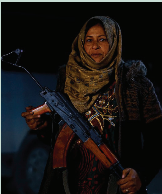
Sopra: gennaio 2022, le donne delle forze di protezione civile durante i turni notturni di vigilanza a Heseke, in un momento in cui la situazione è pericolosa.